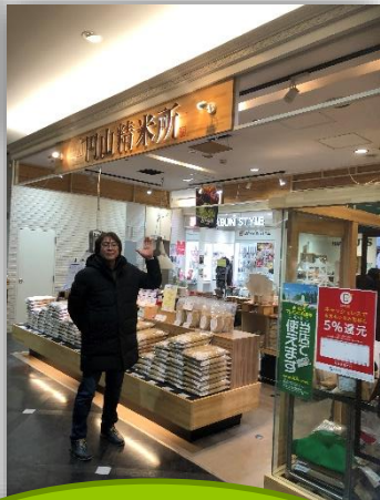
円山精米所 札幌へ行ったらぜひ玄米専門店です♡

時間が空いたので、マルヤマクラスというショッピングモールへ。千野米穀店が経営する玄米専門店があります。こちらでは玄米を販売。もちろんその場で精米もOKです。