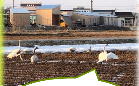
多いときは30羽以上います。

今年はフレコンバッグ用の釣るし器具を購入したので、ずいぶん作業しやすくなったようです。