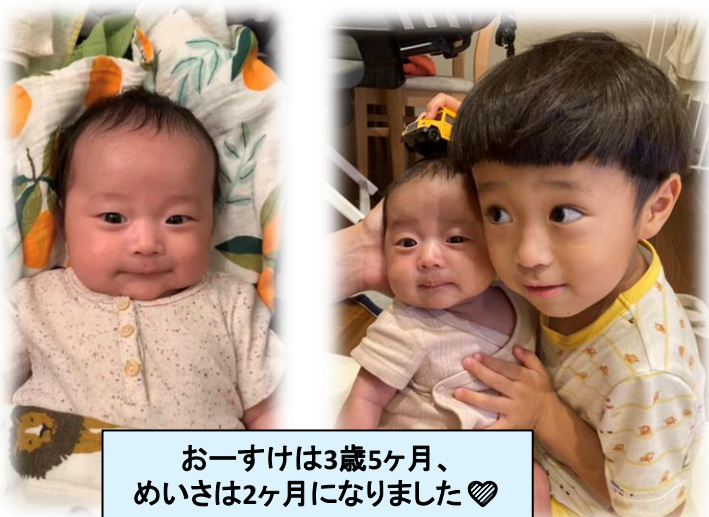
お一すけは3歳5ヶ月、めいさは2ヶ月になりました♡

今は川崎の自宅にいるので、たまにビデオ電話していま～す。主は電話したくてうずうず～笑