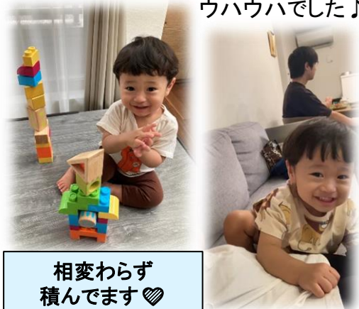
相変わらず積んでます♡

長女がいつもビデオを送ってきます。ついに「じじ！」といえるようになり、主はウハウハでした♪