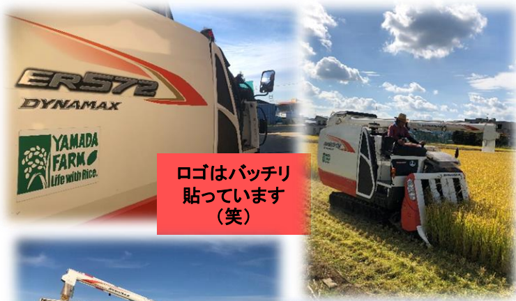
ロゴはパッチリ貼っています(笑)

今年は21日から始まりました。いつもより遅い気もしますが、稲はいい感じです。苗植え～直播～飼料用と、順次刈り取っていく予定です。青天の霹靂は10月9日からの発売になります。コシヒカリは10月下旬になりそうです。