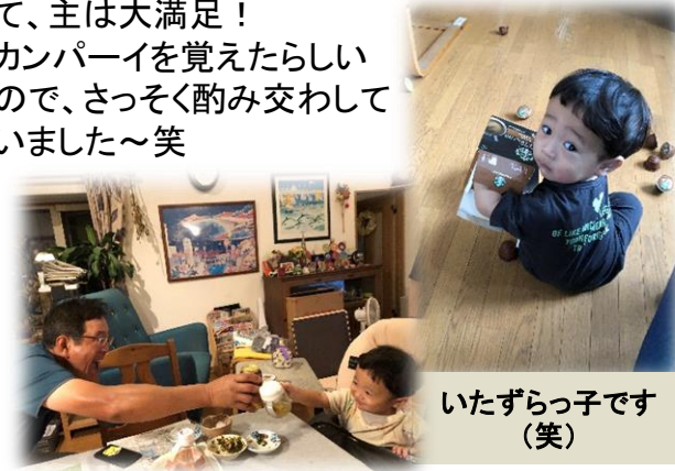
いたずらっ子です(笑)

姑のワクチン接種が終わったので、ちょこっと青森に遊びに来ました。3日間という短い期間でしたが、一緒に遊べて、主は大満足！ キャンイを覚えたらしいので、さっそく酌み交わしていました～笑